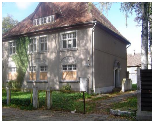
Jaunimo mokykla K.Kalinausko gatvėje 1997m.

Kaip žinia, jaunimo mokyklos yra pagrindinį išsilavinimą teikiančios įstaigos, todėl atsirado problemų dėl vidurinio mokymo. Sprendžiant šį klausimą, 1997 m. rajono tarybos sprendimu Jaunimo mokykla buvo reorganizuota į dvi savarankiškas mokymo įstaigas: Jaunimo mokyklą ir Suaugusiųjų mokymo centrą. Atskirai šios įstaigos veikė tik 9 metus.