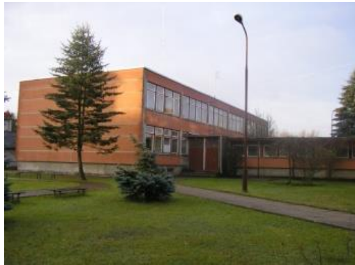
Šilutės jaunimo ir suaugusiųjų mokymo centras 2006 m.

2006 m. rajone vėl įvyko švietimo įstaigų reorganizacija, kurios rezultatas – Šilutės jaunimo ir suaugusiųjų mokymo centras. Jis duris jaunimo klasių ir suaugusiesiems mokiniams atvėrė naujose patalpose Liepų g. 16.