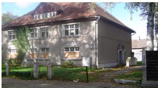
Jaunimo mokykla K.Kalinausko gatvėje 1993m.

1993 m. visoje respublikoje kuriantis jaunimo mokykloms, prie Šilutės suaugusiųjų vidurinės mokyklos buvo įsteigtos jaunimo klasės. Jos skirtos neturintiems mokymosi motyvacijos arba dėl kitų priežasčių nelankantiems bendrojo lavinimo mokyklų 12-16 m. paaugliams.