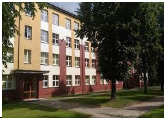
Šilutės jaunimo ir suaugusiųjų mokymo centras nuo 2017 m. vasaros.

2017 m. Šilutės jaunimo ir suaugusiųjų mokymo centras vėl perkeltas į K. Kalinausko gatvę, tik jau į 10 Nr. pažymėto renovuoto pastato, kuriame įkurta „Žibų“ pradinė mokykla, 3-iąjį aukštą.