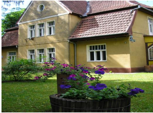
Suaugusiųjų mokymo centras 1997 m.

2006 m. rajone vėl įvyko švietimo įstaigų reorganizacija, kurios rezultatas – Šilutės jaunimo ir suaugusiųjų mokymo centras. Jis duris jaunimo klasių ir suaugusiesiems mokiniams atvėrė naujose patalpose Liepų g. 16.